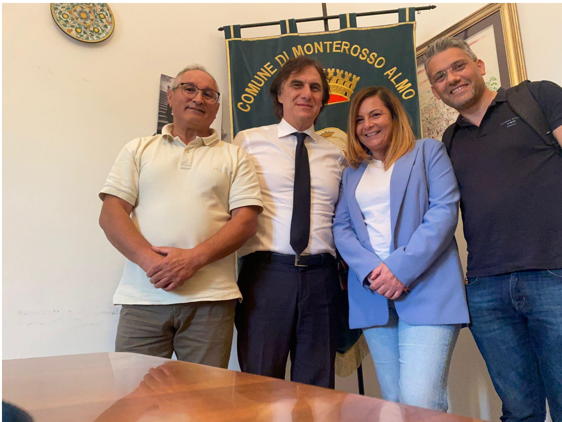
ANIMAZIONE COMUNE DI MONTEROSSO ALMO 11.10.2023