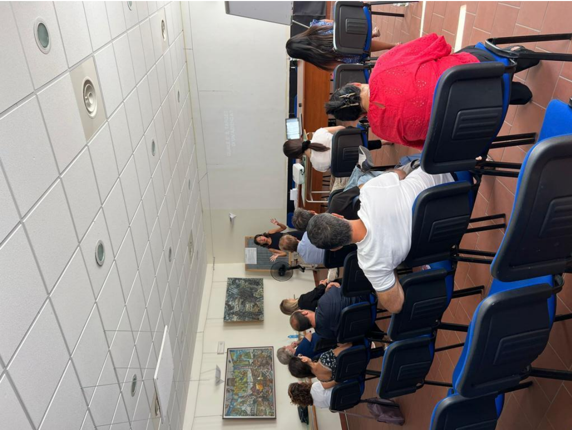
ANIMAZIONE COMUNE DI FRANCOFONTE 10.10.2023