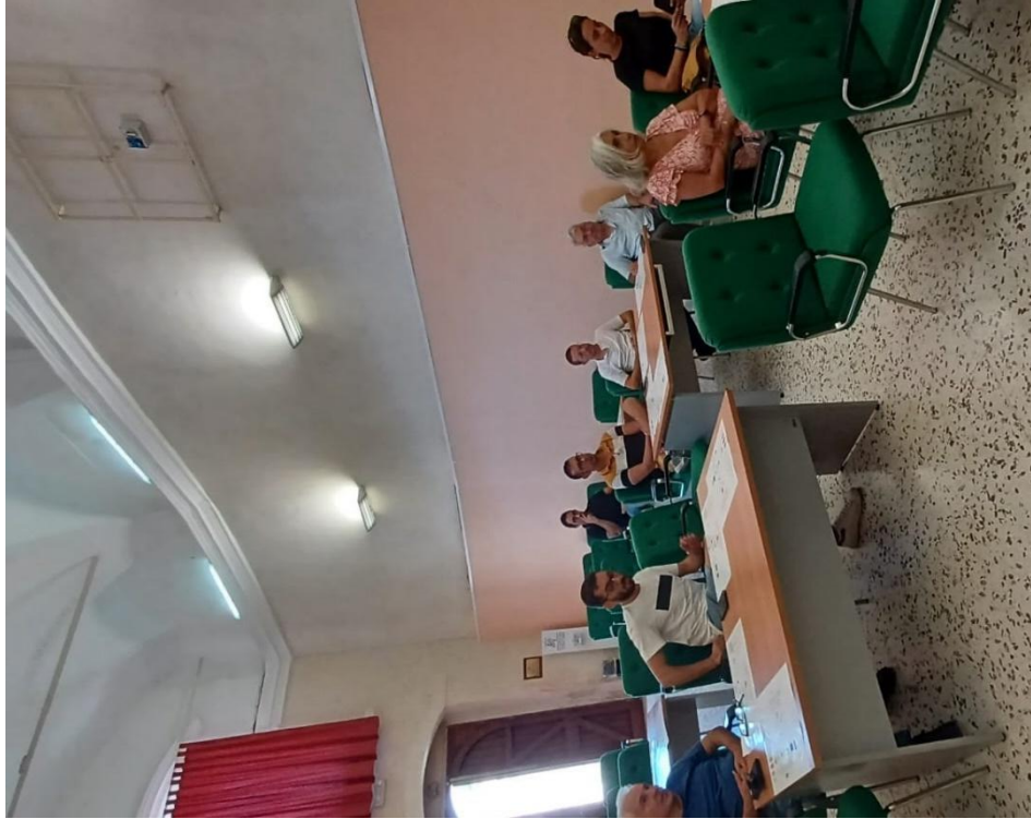
ANIMAZIONE COMUNE DI BUCCHERI 22.09.2023