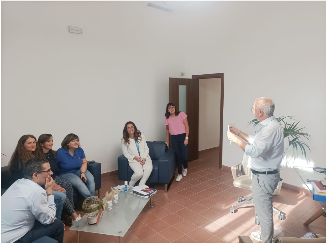
ANIMAZIONE COMUNE DI FERLA 04.10.2023