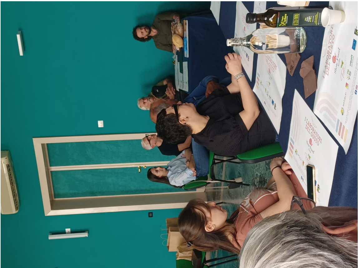
ANIMAZIONE COMUNE DI PALAZZOLO ACREIDE 17.10.2023