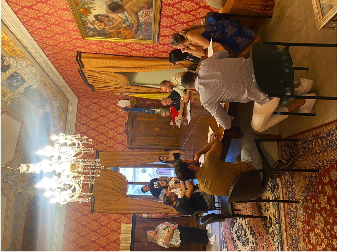
ANIMAZIONE COMUNE DI SCORDIA 19.09.2023