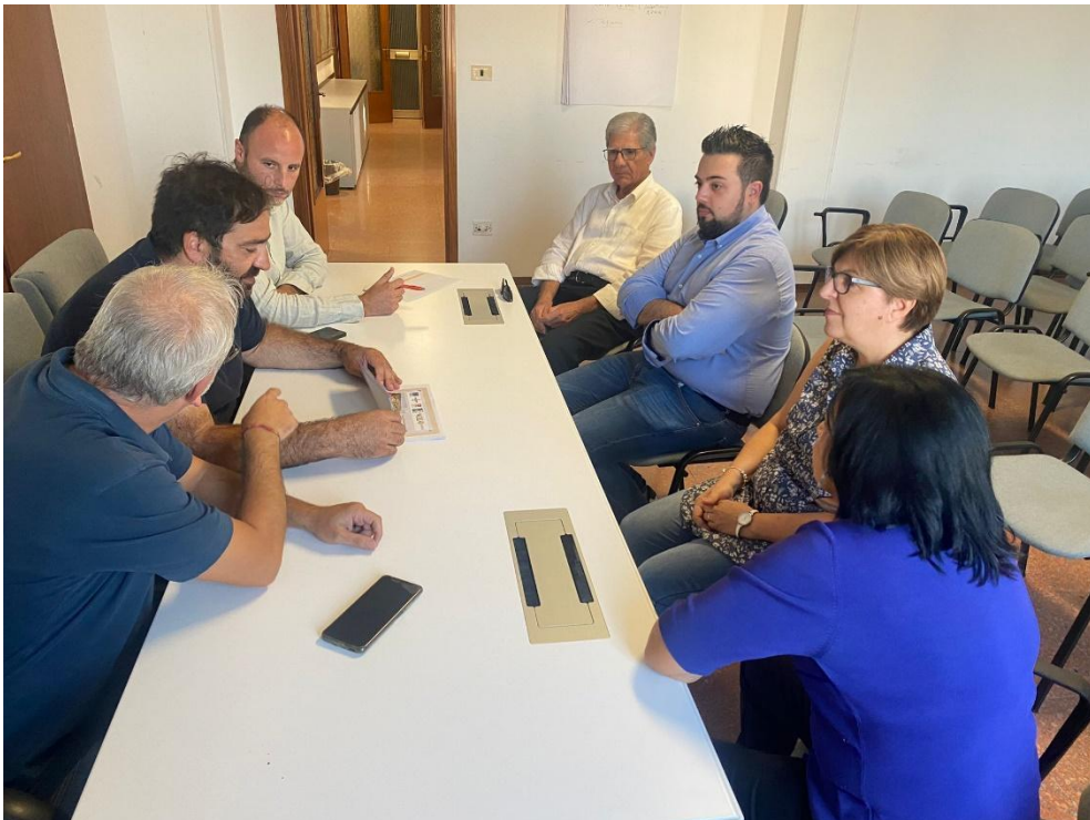
ANIMAZIONE COMUNE DI CANICATTINI BAGNI 05.10.2023