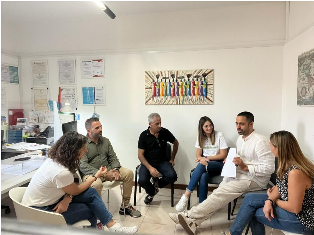
ANIMAZIONE COMUNE DI SORTINO 04.09.2023