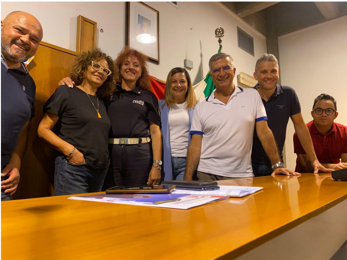
ANIMAZIONE COMUNE DI GIARRATANA 11.10.2023