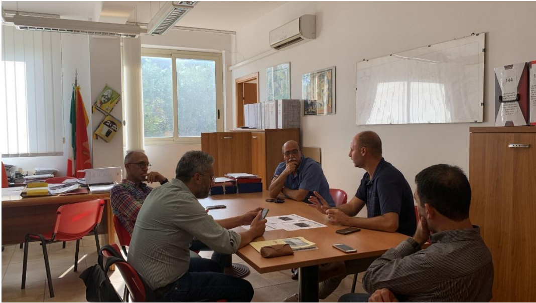
ANIMAZIONE COMUNE DI VIZZINI 09.10.2023