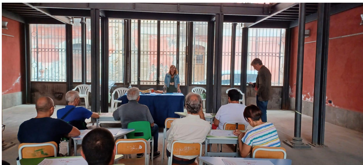
ANIMAZIONE COMUNE DI LENTINI 11.09.2023