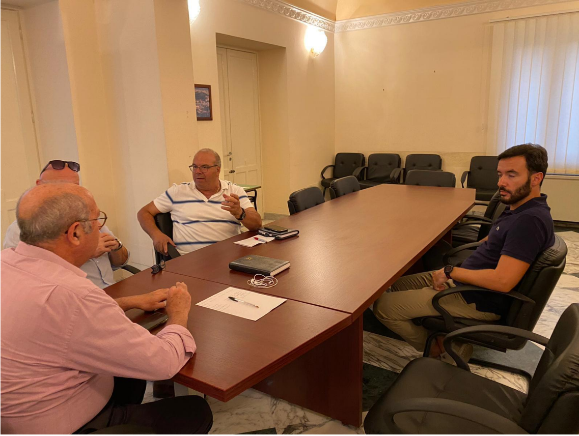
ANIMAZIONE COMUNE DI CARLENTINI 13.10.2023