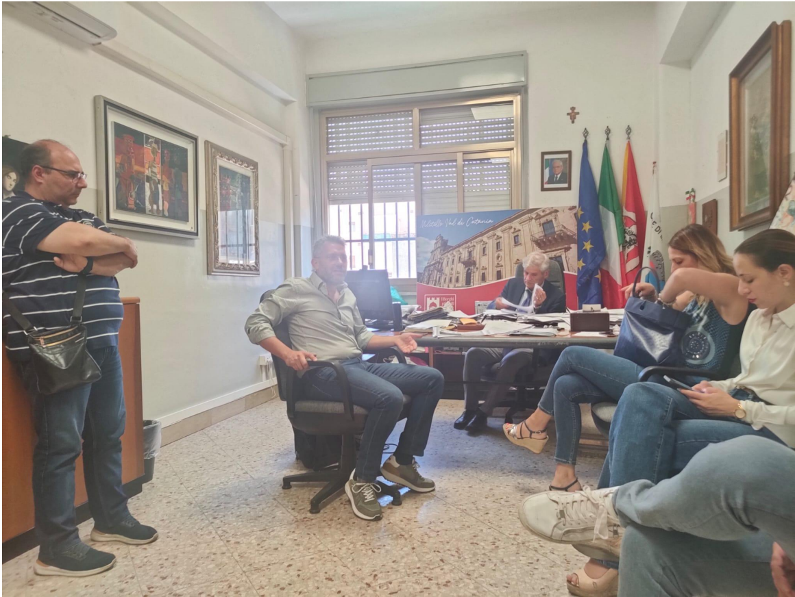
ANIMAZIONE COMUNE DI MILITELLO VAL DI CATANIA 09.10.2023