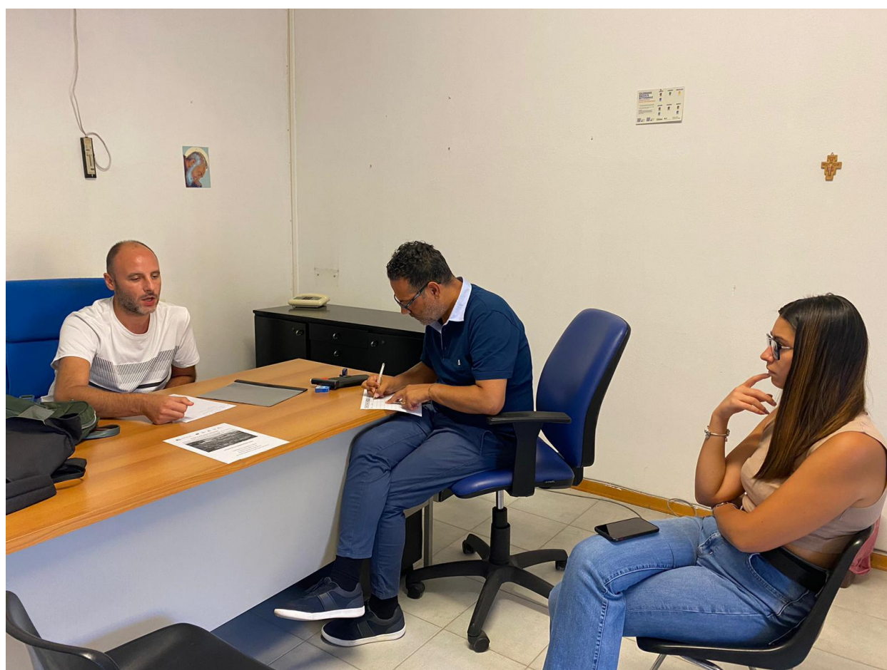
ANIMAZIONE COMUNE DI LICODIA EUBEA 11.09.2023